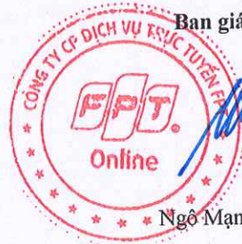
Ngô Mạnh Cường